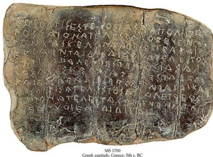
Prilog 1: Prikaz jedne grčke pločice za proklinjanje ( katadesmoi )

imali moć prokleti nekoga i nautiti mu, već da su oni bili korišteni kao dostavljači tih pločica htoničnim božanstvima. Neke od njih sadržavale su samo ime osobe koju se željelo prokleti, no druge su otvoreno iznosile formule kojima se želi prokleti jezik, oči, usta, ruke i noge ili duša imenovane osobe i pritom se zaziva pomoć podzemnih božanstava. Drugi način proklinjanja bio je postavljanje male metalne figurice sa zavezanim rukama u lijes s uputama na unutrašnjoj strani poklopca. Budući da su takvi predmeti nađeni u mnogim grobnicama pretpostavlja se da su profesionalno izrađivani i da su postojali ljudi kojima je izrađivanje takvih „pločica prokletstva“ bio zanat. O tome govori i Platon i navodi da, ukoliko netko želi nautiti svom neprijatelju, može to napraviti svojom zlobom i bacanjem uroka bez obzira je li njegov neprijatelj dobra ili zla osoba.