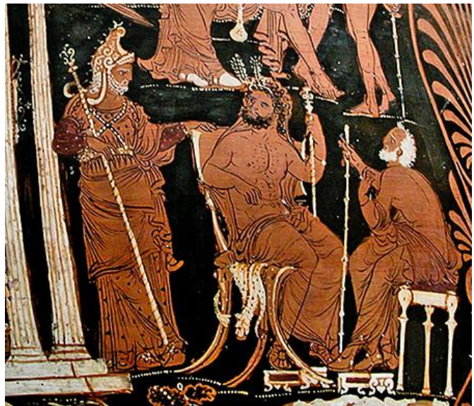
Prilog 6: Prikaz triju sudaca u Hadu