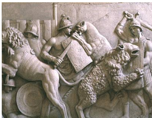
Prilog 2: Rimski reljef s prikazom borbe gladijatora i lavova

Nasilna smrt i samoubojstvo nisu bile ugodne i bezbolne smrti, ali ukoliko se s njima suočilo hrabro, bile su poželjan način umiranja. Način na koji su ljudi dočekali svoj kraj, i fizički i psihički, bio je ključni čimbenik za to kako će ih se posthumno pamtiti. Dobra smrt značila je suočiti se s krajem hrabro i dostojanstveno, pokazati obzir i brigu za voljene, uputiti im nekoliko posljednjih riječi, biti dostojno oplakan od živućih te biti poštovan od strane neprijatelja. Bojati se smrti, misliti samo na sebe, govoriti nervozno, nekontrolirano plakati i ne biti dostojno oplakan bila je nepoželjna smrt koja je čak mogla dovesti do sakaćenja trupla i proklinjanja pokojnika. 40