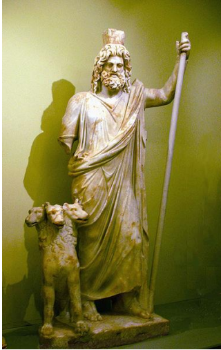
Prilog 7: Slika Hada

Had je bio bog mrtvih i istoimenog podzemnog kraljevstva, Zeusov i Posejdonov brat čije je ime smatrano toliko strašnim da se nije smjelo ni izgovoriti. Bio je čudovištan i snažan, najomraženiji od svih bogova tako da mu nije podignut nijedan hram i nisu mu se prinosile žrtve. Najpotpunije podatke o Hadu donijela je Homerova Himna Demetri , približno iz 7. st. pr. Kr. u kojoj se navodi da je on bog tamne kose i u kojoj se opisuje najpoznatiji mit povezan s Hadom, a to je otmica Perzefone. 66