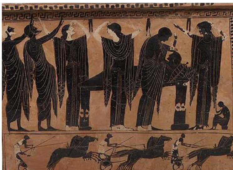
Prilog 3: Slika izlaganja tijela ( prothesis ) i žalovanja

statusu osobe i o tuzi preživjelih tako da je Ahilejev pogreb trajao 17 dana, Hektorov 9 dana, a Patroklov samo dva dana. U geometrijskom razdoblju i nadalje, ceremonija je trajala jedva i 24 sata i događala se dan poslije smrti. 46 Prema Platonu, tijelo je trebalo izlagati najmanje jedan dan kako bi se osiguralo dostojno žalovanje, ali i uvjerilo da je osoba doista umrla. Budući da je voda u kući umrloga smatrana onečišćenom, s nekog drugog mjesta donosilo se posudu s vodom i stavljalo je se pokraj vrata kako bi ožalošćeni, koji su kao i kuća onečišćeni smrću, mogli oprati ruke. Voda je također upozoravala prolaznike na prisutnost smrti u toj kući. 47