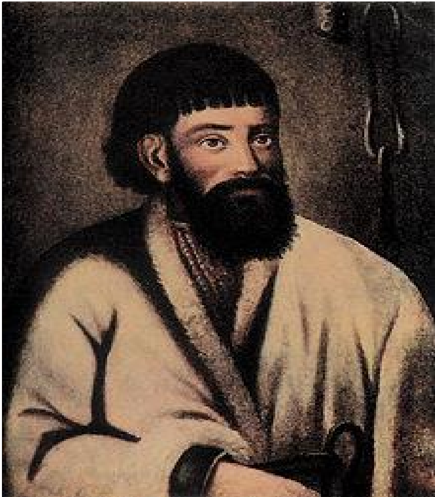
Prilog 4. Jemeljan Pugačov