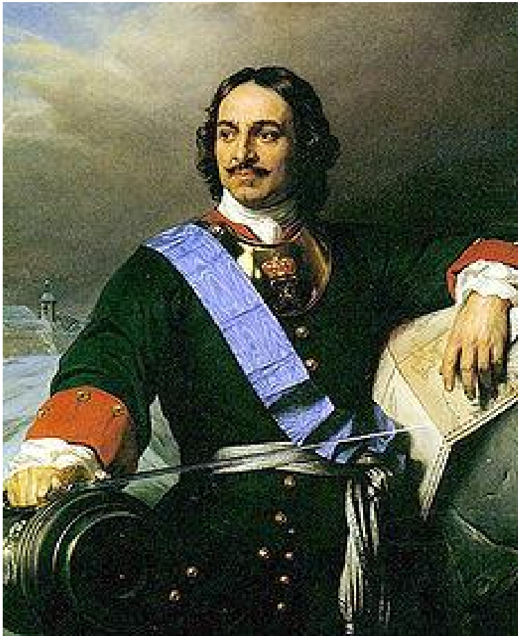
Prilog 2. Petar I. Veliki