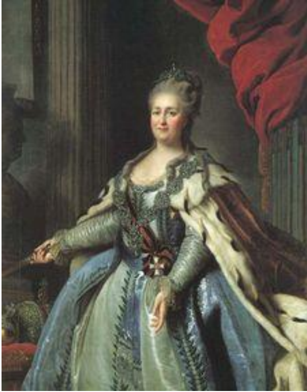
Prilog 3. Katarina II. Velika