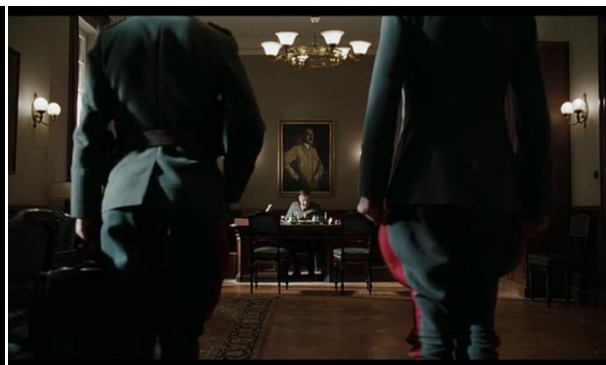
Abb. 35: Hitlers Portrait im Hintergrund, Singer (27:23)