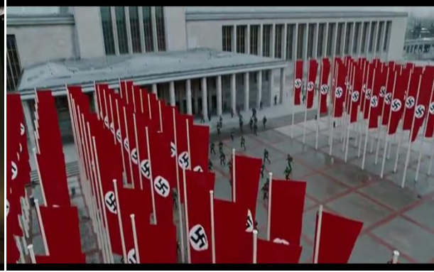
Abb.37: Hakenkreuze im SS Hauptquartier, Singer(1:29:30)