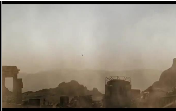
Abb. 4: Schlachtfeld in Tunesien, Singer (5:37)