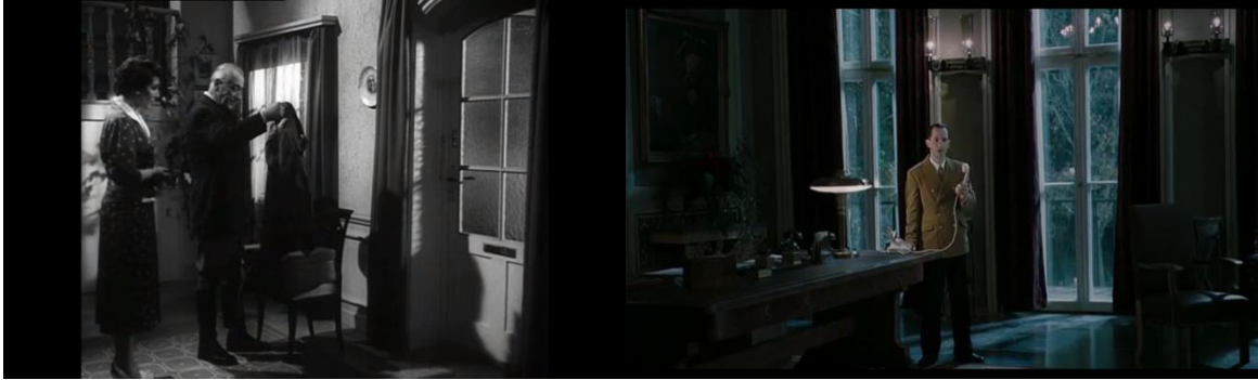
Abb. 7: Höpfner begrüßt Olbrichts Frau, Pabst (17:04) Abb. 8: Göbbels vor dem Haftversuch, Singer (1:33:23)