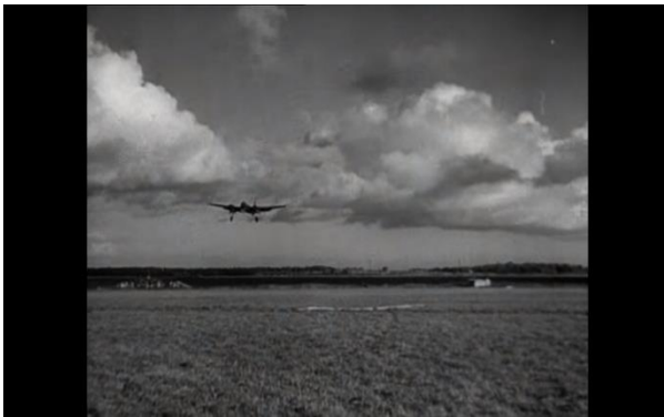
Abb. 3: Ein Flugzeug hebt ab, Pabst (33:20)