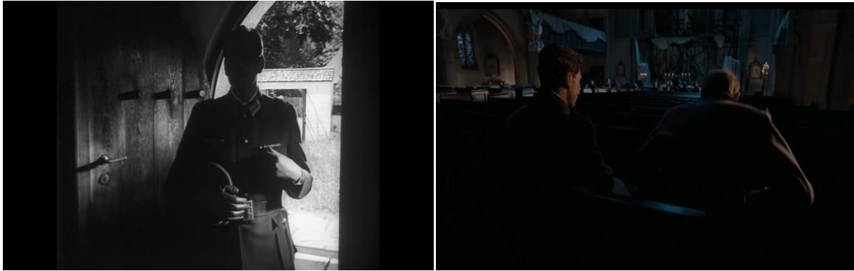
Abb.40: Stauffenberg betretet vor dem Attentat die Kirche Abb. 41: Stauffenberg mit Olbricht in der Kirche, Singer (17:31) Pabst, (12:27)