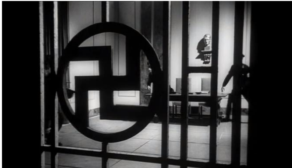
Abb.38:Hakenkreuz, Pabst (48:30)