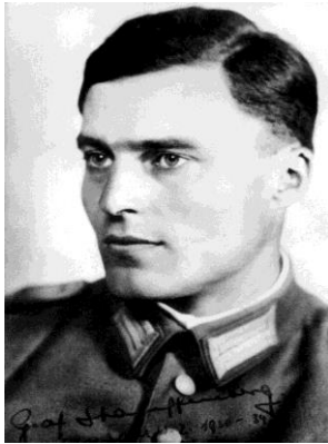
Abbildung 2: Claus Schenk Graf von Stauffenberg

Claus Schenk Graf von Stauffenberg wurde am 15. November 1907 in Jettingen in einer schwäbischen Adelsfamilie geboren. Sein Zwillingbruder starb einen Tag nach der Geburt. Stauffenberg wuchs zusammen mit seinen 2 Jahre älteren Zwillingbrüdern in Stuttgart auf (Hoffmann 2009: 28). Nach dem bestandenen Abitur im Jahr 1926, schloss er sich der Reichswehr an. Er entschloss sich für diesen Beruf, weil er seinem Vaterland dienen wollte (ebd.: 92). Im Jahr 1938 wurde er Zweiter Generalstabsoffizier unter Generalleutnant Hoepner, der zum Verschwörerkreis gehörte. Nach 6 Jahren wurde er zur 10. Panzerdivision, die den Rückzug in Afrika deckte, versetzt. Kurz nach der Versetzung wurde er schwer verletzt. Wie schwer seine Verwundungen waren beschreibt West in seinem Buch sehr bildhaft: