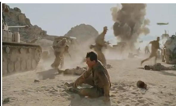
Abb. 6: Stauffenberg beim Luftangriff in Tunesien Singer (55:14)