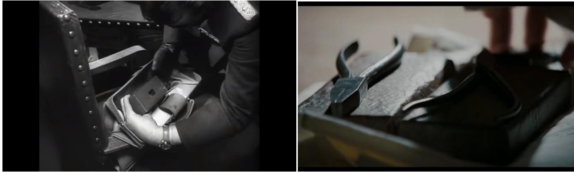
Abb. 31: Stauffenberg hat nur eine Ladung (23:45), Pabst Abb. 32: Bei Singer sind es zwei Ladungen (1:05:12)