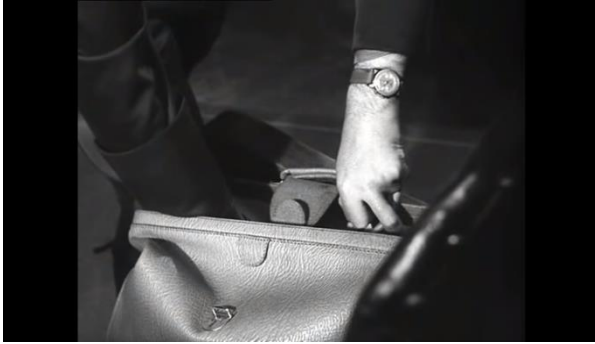
Abb.17: Stauffenberg macht die Bombe scharf, Pabst (23:57)