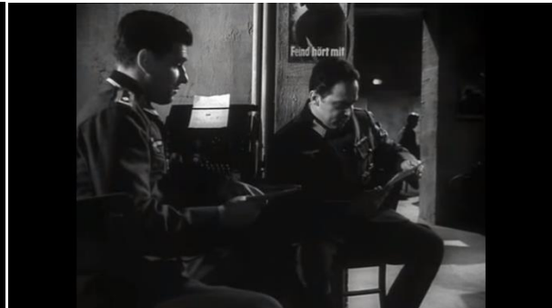
Abb.39: Plakat im Hintergrund- „Feind hört mit“, Pabst (1:14:25)