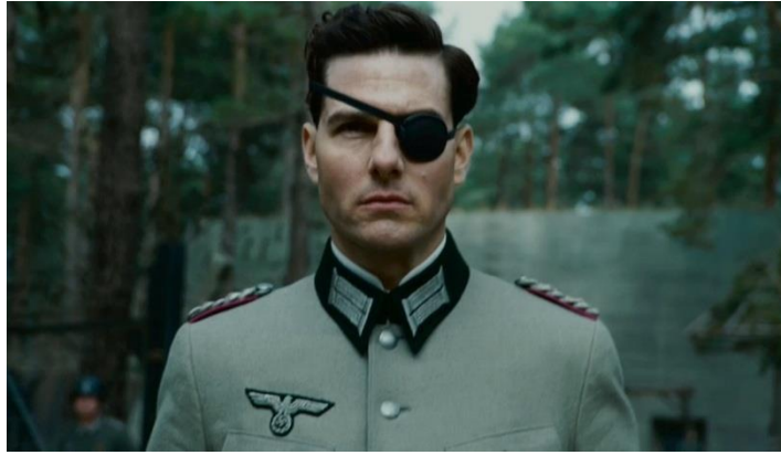
Abbildung 26: Tom Cruise als Stauffenberg, Singer