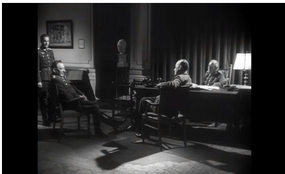
Abb. 5: Die Verschwörer waren auf Fromm, Pabst (1:03:49)