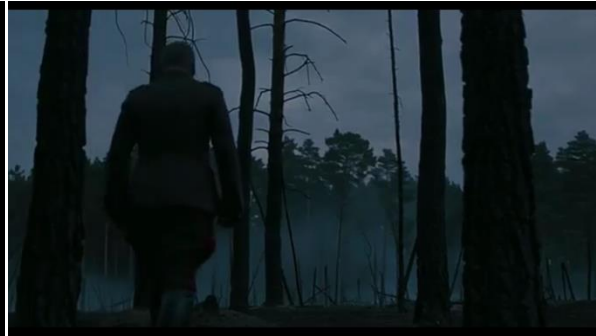
Abb.22: Tresckow begeht Selbstmord, Singer (1:47:04)