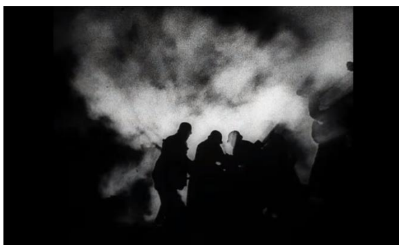
Abb. 29: Anfang bei Pabst (02:52)

Pabsts Film beginnt mit einem nächtlichen Bombenangriff am 20. Juli 1944 und der Ansage des Voice Over Kommentars, dass dieser Tag alles verändern wird. Im Gegensatz zu Singers „Valkyrie“, der mit Stauffenbergs Einsatz schon im April 1943 in Tunesien anfängt. Wichtig zu erwähnen ist, dadurch dass sich Singer nicht nur auf den 20. Juli konzentriert hat, sondern auch einen großen Wert auf die Vorgeschichte gelegt hat, hat er eine bessere Grundlage für das Verstehen der gesamten Geschichte geliefert. So spielt der 7. Juni 1944, der Tag an dem Hitler, der von den Verschwörern abgeänderte Walküre-Plan, ohne ihn durchzulesen, unterschreibt, eine wichtige Rolle. Gegenüber der anderen Verfilmung, nimmt auch der Konflikt zwischen Goerdeler und Stauffenberg eine wichtige Position ein. Carl Friedrich Goerdeler kommt in Pabsts Film überhaupt nicht vor, und bei Singer wurde er als Verschwörer beschrieben, der aber gegen Hitlers Ermordung war. Singer war es sehr wichtig durch seine Figur zu zeigen, dass nicht alle einer Meinung waren, aber dass sie trotzdem für das Gleiche gekämpft haben. 38