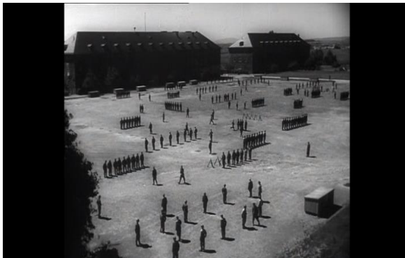
Abb.23: Die Armee war einsatzbereit, Pabst (38:39)