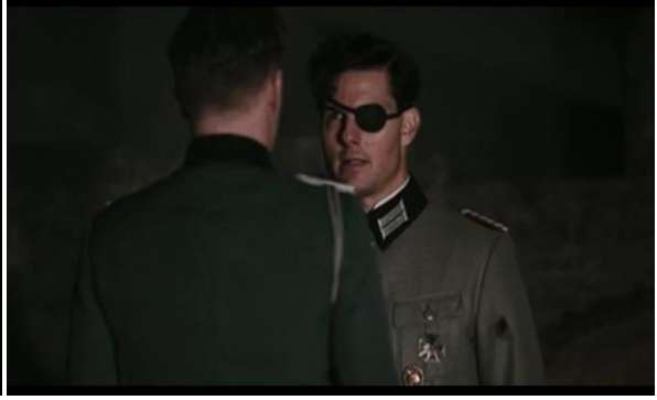
Abb.42: Die gemeinsame Hinrichtung der Hauptverschwörer bei Pabst (1:13:25) Abb. 43: Die einzelne Hinrichtung bei Singer (1:48:34)