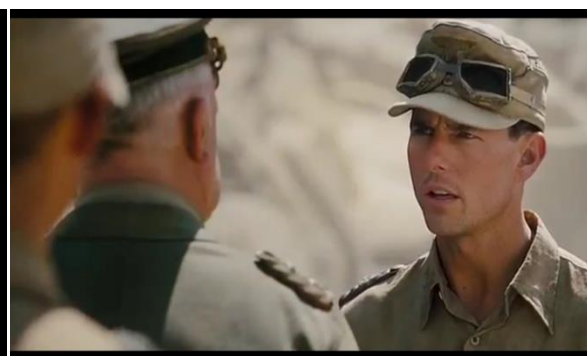
Abb.30: Anfang bei Singer (05:37)