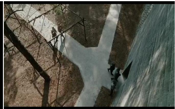
Abb. 24: Stauffenberg und Haeften gehen zur Lagebesprechung, bei der das Attentat verübt werden soll, Singer (53:57)