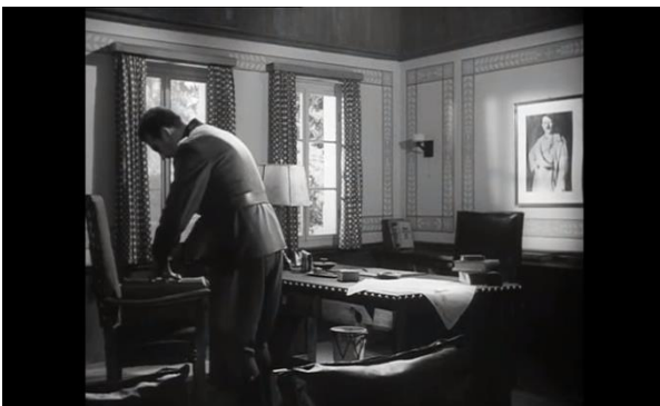
Abb. 34: Hitlers Portrait im Hintergrund als Stauffenberg die Bombe scharf macht. (24:03), Pabst

In der Verfilmung aus dem Jahr 1955 sieht man, dass mit Hitlers Figur sehr vorsichtig umgegangen worden ist. Hitler sieht man nur von hinten, aber als reale Person kommt er nicht vor, trotzdem spürt der Zuschauer seine Anwesenheit. Szenen, wo Stauffenberg gegen die Zeit kämpft, werden durch Führers Porträts im Hintergrund noch zusätzlich angespannt, vor allem wegen der Gedanken, dass er immer alles beobachtet (siehe Abb. 34 und 35). Interessant zu erwähnen ist, dass Hitlers Präsenz, in Pabsts Film auch durch Plakate mit der Überschrift „Feind hört mit“ hervorgehoben wird, was auf der Abbildung 39 zu sehen ist. Auch mit dem nazistischen Hakenkreuz ist man in dem Film aus 1955 vorsichtig umgegangen. Man sieht sie im Film sehr selten und meist nur im Hintergrund. Anders als in der bereits genannten Adaption ist in Singers Verfilmung aus dem Jahr 2008, wo Hitler sowohl durch seine Porträts als auch mit seiner Figur anwesend ist. Bei Singer ist auch Hitlers Meldung übers Radio zu hören, in der er dem Volk mitteilen will, dass er das Attentat überlebt hat. In der „Valkyrie“ Verfilmung kommt es sogar zum Gespräch zwischen Protagonist und Antagonist - Hitler und Stauffenberg, was auf der Abbildung 36 zu sehen ist. Obwohl man ihn als reale Person zu sehen bekommt, haben seine Porträts dieselbe Wirkung wie in Pabsts Film. Singer zeigt sogar eine Szene in der Stauffenberg auf Haefdens Frage, wie der Krieg enden wird, antwortet: „Das Porträt wird abgehängt, und der Mann aufgehängt“.