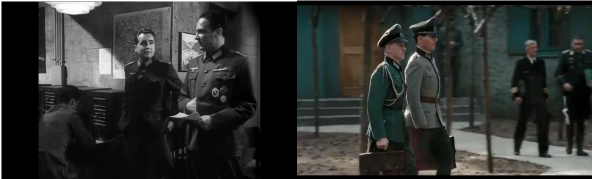
Abb.9: Offiziere in der Nachrichtenzentrale, Pabst (57:51) Abb.10: Stauffenberg und Haefen gehen zur Lagebesprechung, bei der das Attentat verübt werden soll, Singer(53:45)