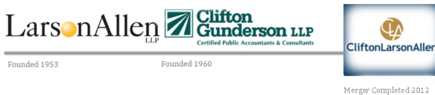
Slika 6. Logotip tvrtki Clifton Gunderson i Larson Allen prije i nakon udruživanja. URL: http://www.desantisbreindel.com/brand-identity-post-merger/