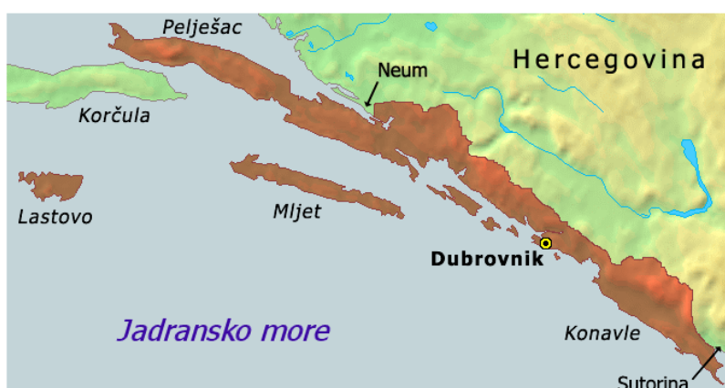
Slika 5. Karta Dubrovačke Republike 32

Znatno povoljnije stanje na području školstva bilo je u Dubrovniku i Dubrovačkoj Republici zbog njezinog specifičnog političkog položaja i gospodarske snage. Na dubrovačkom području otvaraju se škole i u okolnim selima. Povoljnije stanje na području školstva osjeća se poslije 1848. godine ukidanjem kmetstva i uvođenjem hrvatskog jezika kao službenog u javnu uporabu pa time i u području školstva. U području školstva sve se više osjeća određena autonomija. U školskim reformama Ministarstvo nastave uvelo je određenu autonomiju na području školstva kroz Zemaljske školske oblasti . Takva je zemaljska oblast za Dalmaciju osnovana 1850. godine. Godine 1869. donesen je liberalniji školski zakon koji je vrijedio i na području Dalmacije. Prema ovom zakonu škole su: javne i privatne, osnovne i gradske, muške i ženske, besplatne i osnovne. Ovaj je zakon bio temeljem na području Austro-Ugarske, ali će istovremeno omogućiti da Zemaljske školske oblasti pristupe samostalnom reguliranju svojeg školstva i uvođenja školske obveznosti. 31