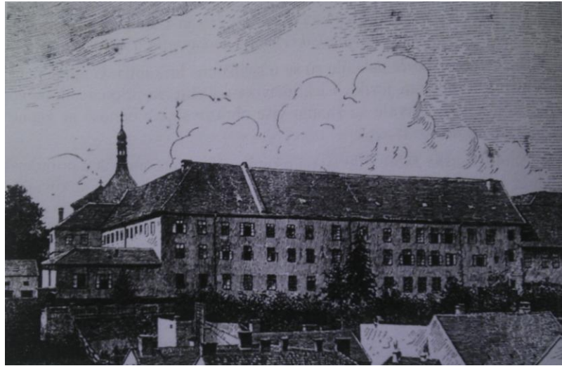
Slika 2. Samostan isusovaca u Zagrebu 12

zagrebačke jezuitske akademije. I pored značajnijih organizacijskih poboljšanja jezuitske škole su ostale izrazito vjerski orijentirane. 11