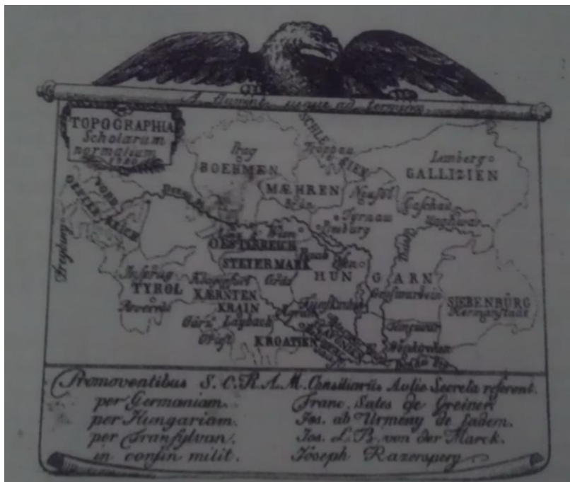
Slika 4. Topografija normalnih škola 22

U sjedištu svake komisije treba postojati normalna škola. U normalnim školama u pravilu rade četiri učitelja i kateheta. Normalne škole, isto kao i glavne mogu imati dva godišta četvrtog razreda, a pored redovitog obrazovanja, skrbile su i za obrazovanje učiteljskog podmladka. Tadašnje obrazovanje učitelja bilo je u sastavu elementarnog, još nije bilo podignuto na srednješkolsku razinu. Normalne škole osiguravaju mogućnost učiteljskog obrazovanja za one koji ne namjeravaju nastaviti srednješkolsko obrazovanje. Učiteljske kandidate u pedagogiji podučavaju je ravnatelj. Temeljni udžbenik bio je Methodenbuch . Uz navedene trivijalne, glavne i normalne škole, još su jedno vrijeme dijelovale i gradske škole. 21