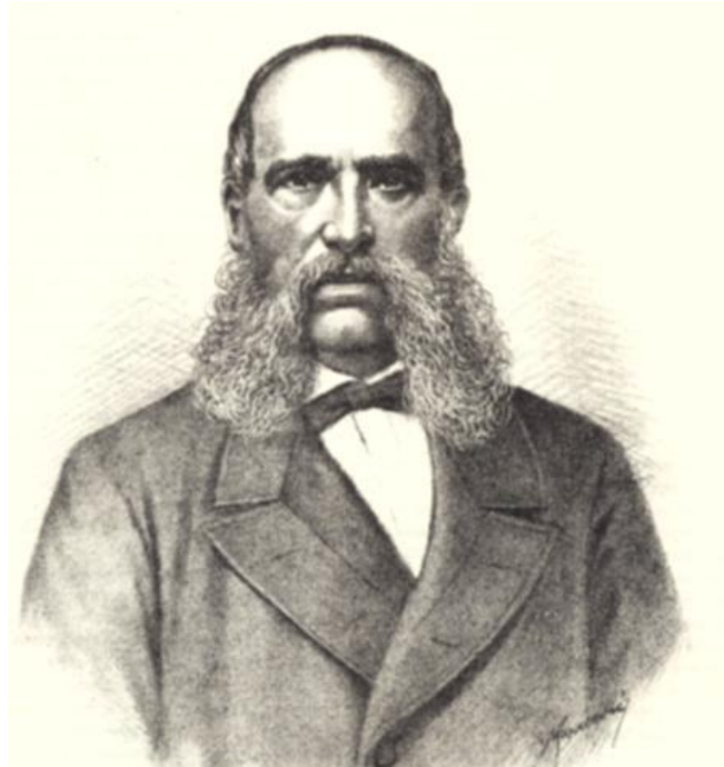
Slika 8. Ivan Mažuranić, ban Hrvatske, Slavonije i Dalmacije 55

Ovim zakonom Hrvatska prvi puta samostalno i autonomno uređuje svoje školstvo. Tim je zakonom i formalno uvedena školska obveznost. Zakon u stručnom i političkom smislu predstavlja krupan iskorak i napredak. Prema njemu, uvodi se obvezna niža četverogodišnja pučka škola, uz koju djeluje opetovnica i po mogućnosti početni oblici praktičnog osposobljavanja za život. Po završetku niže pučke škole postoji građanska škola u najmanje trogodišnjem trajanju. U njoj se učenici početno profesionalno osposobljavaju za zanimanja iz obrta, trgovine i umnog gospodarstva. Uz državne škole, zakon je predviđao i različite mogućnosti privatnih škola, pa i početno obrazovanje u obitelji. 56