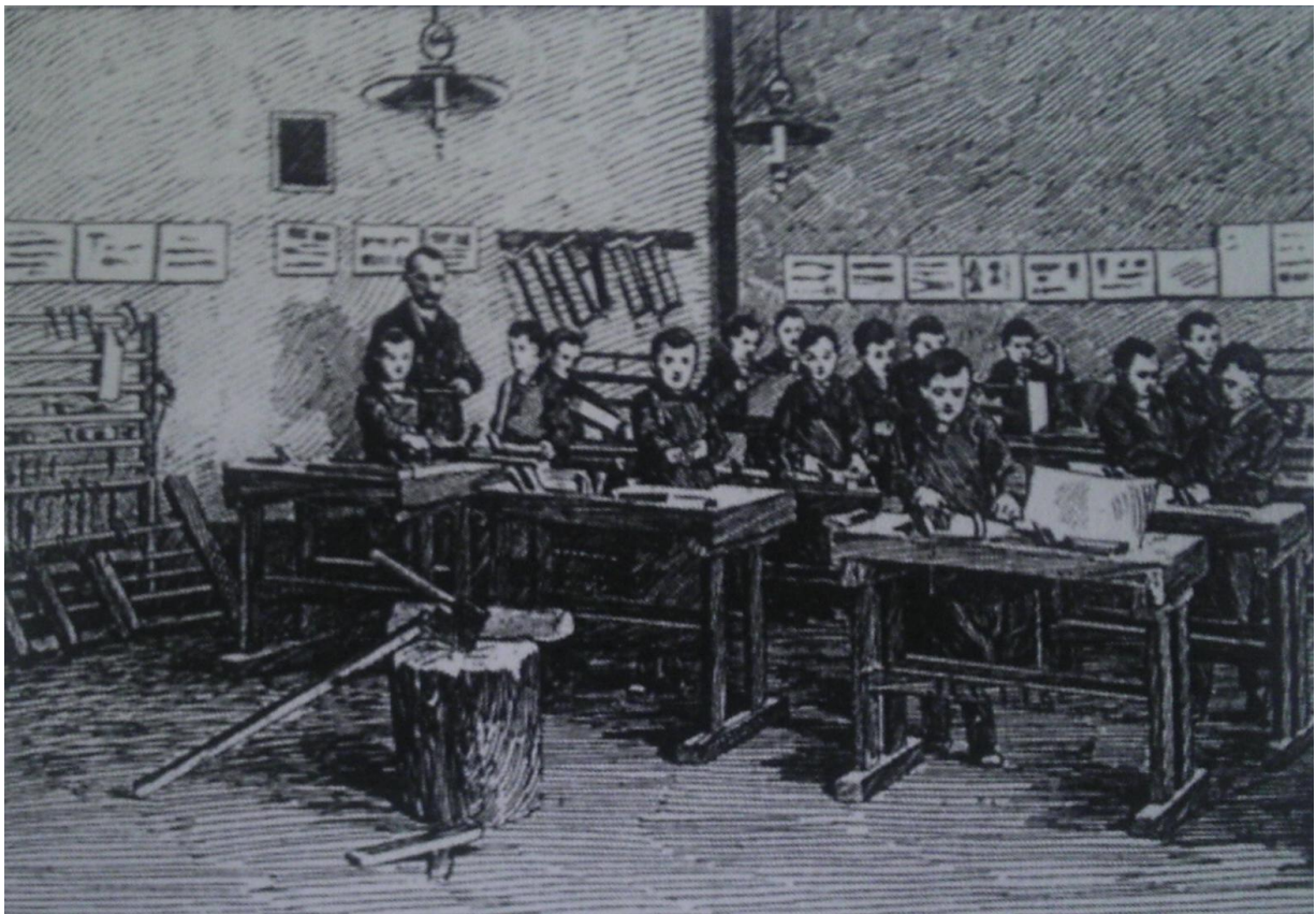
Slika 11. Mladež zagrebačke donjogradske pučke škole pri obuci u sløjdu 64

U drugoj polovini XIX. stoljeća uz nastavu organiziraju se i različiti oblici izvanškolskog i izvannastavnog rad. Preuzimaju se i značajnije inovacije iz nekih zapadnoeuropskih zemalja i ugrađuju u naš školski sustav. Kao primjer, navodi se nastava sløjda koja je preuzeta iz Švedske, krajem 19. stoljeća. To je bio specifični odgojni ručni rad za dječake – sløjda - koji se u hrvatskim školama zadržao desetak godina. Kako bi se olakšalo uvođenje sløjda u škole, školske vlasti su organizirale stručne tečajeve u Zagrebu, Petrinji, Osijeku, Požegi i Varaždinu. Nakon ukidanja sløjda , za dječake se ručni rad uvodi u okviru nastavnoga predmeta gospodarstvo s ručnim radom . 63