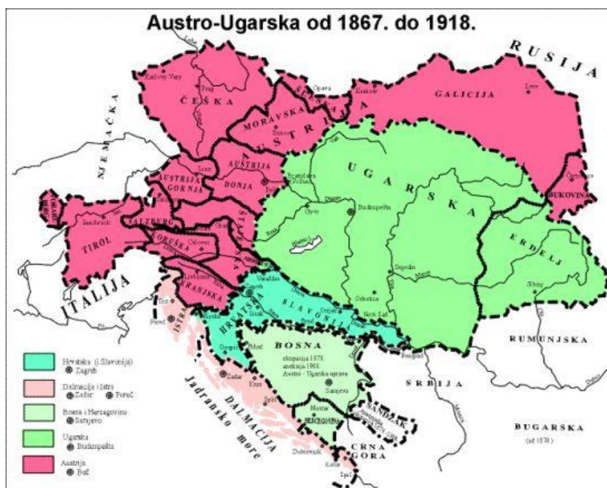
Slika 7. Karta Austro-Ugarske od 1867. do 1918. 52

Padom Bachova apsolutizma (1859.), Hrvatskoj je vraćen Ustav, obnavlja se parlamentarni život (zemaljski Sabori), uistinu i stvarno hrvatski jezik postaje službenim. Dalmacija i Istra (do 1860. Istarsko okružje) dobile su po prvi puta u povijesti, svoje posebne zemaljske sabore. Vojna krajina u suštini zadržala je svoje dotadašnje uređenje. Hrvatske su zemlje u ustavno razdoblje ušle razjedinjene i pored toga što su formalno imale pravo i mogućnost ujedinjenja. Veliko i homogeno Austrijsko carstvo više se nije moglo održavati i njegovim temeljnim preuređenjem stvorena je nova Austro-Ugarska država (1867.). Prema novom ustrojstvu, Dalmacija i Istra ostaju u nadležnosti Austrije, a Hrvatska i Slavonija dolaze u nadležnost Ugarske s kojom trebaju sklopiti poseban ugovor, kojim će regulirati međusobne odnose. Vojna krajina ostaje posebno i izdvojeno područje do svog ukidanja (1881.) i uključivanja u sastav Hrvatske (1886.) godine. U navedenim državno-pravnim okvirima Hrvatska ostaje do završetka Prvog svjetskog rata, te godine 1918. ulazi u novu državno-pravnu zajednicu Kraljevinu Srba Hrvata i Slovenaca (1.XII.1918.), odnosno u Kraljevinu Jugoslaviju (6.I.1929). 51