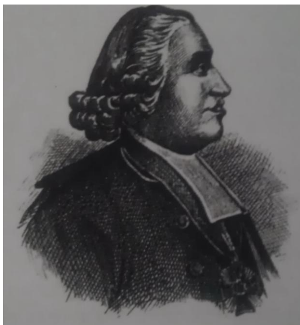
Slika 3. Felbiger Ignaz, opat i organizator austro-ugarskog školstva 20

Ozbiljnije uređenje državnog školstva u Hrvatskoj počinje u vrijeme vladanja carice Marije Terezije (1740-1780). U duhu prosvjetiteljske ideje carica Marija Terezija potiče otvaranje škola sa ciljem da se barem u sjedištu svake župe otvori najelementarniji oblik škole. Školsku reformu povjerila je Johannu Ignazu Felbigeru (1724 - 1788), koji ju je obznanio u Općem školskom redu 1774. godine. Navedeni Opći školski red predviđa: trivijalne, glavne i normalne škole. Za svaku od navedenih škola propisana je posebna nastavna osnova. Trivijalne škole su najelementarnije i trebale su se nalaziti u sjedištima župa. U njima radi jedan učitelj i kateheta, a po potrebi se može namjestiti i učiteljski pomoćnik. U školama se uči elementarno gradivo iz sljedećih predmeta: vjeronauka, biblijske povijesti, čitanja i pisanja (na njemačkom jeziku), računanje do trojnog pravila, nauka o poštenju i gospodarstvu. 19