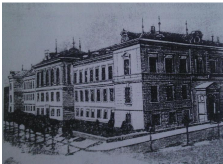
Slika 10. Zgrada pučke škole u Jagerovoj ulici u Osijeku 60

Školske zgrade grade se od čvrstog materijala, a u školskoj zgradi u pravilu se nalazio i učiteljski stan. Prije navedenih školskih zakona škole su bile slabo opremljene o čemu svjedoči popis inventara i učila u školi Novog Vinodolskog 1793. godine u tablici 2., a navode se i knjige: Mali katehizam ilirski , Knjižnica zvana ABCdar , knjižica Einleitung zum Schonschreiben .