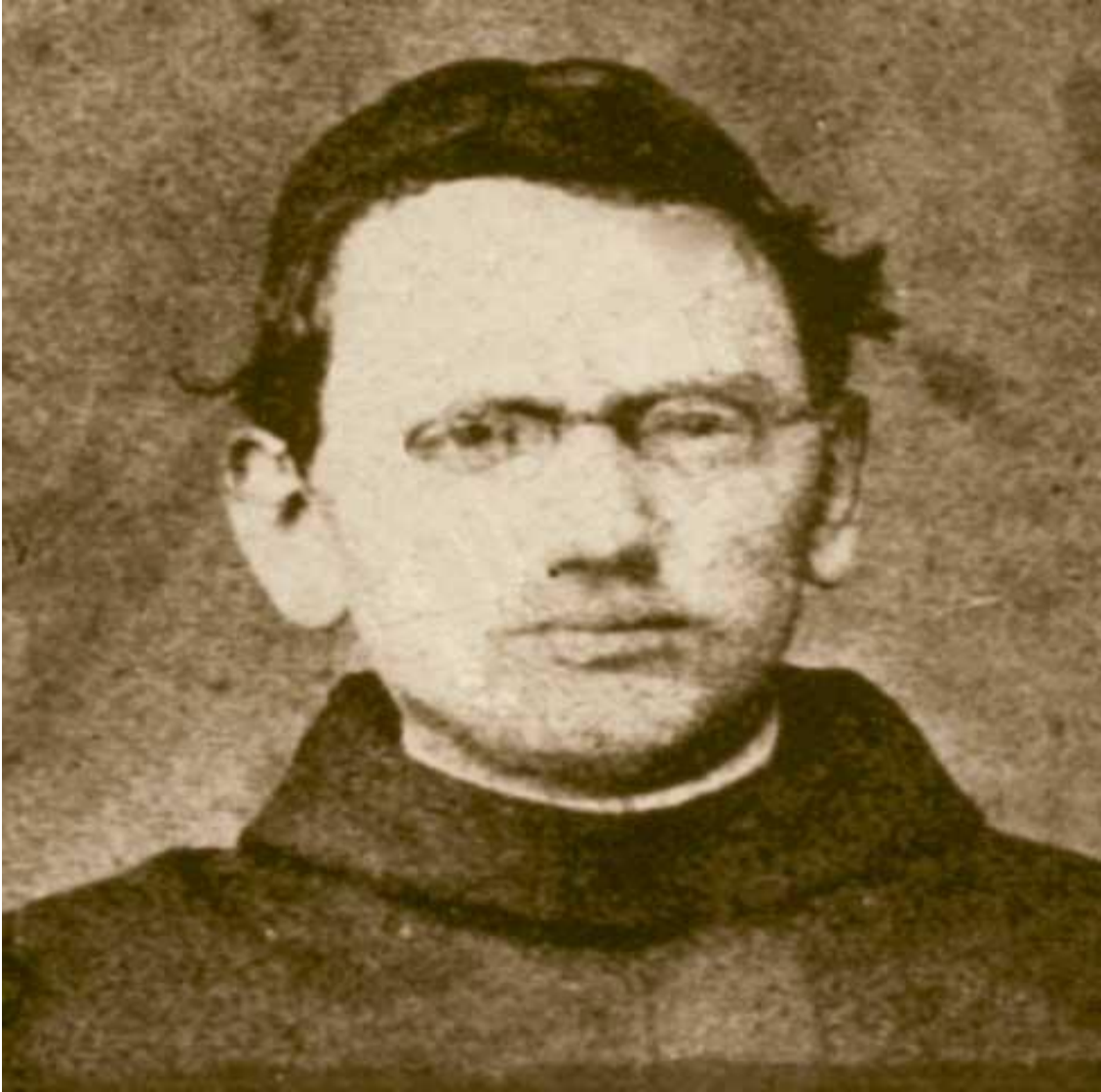
Slika 1. Dragutin Antun Parčić