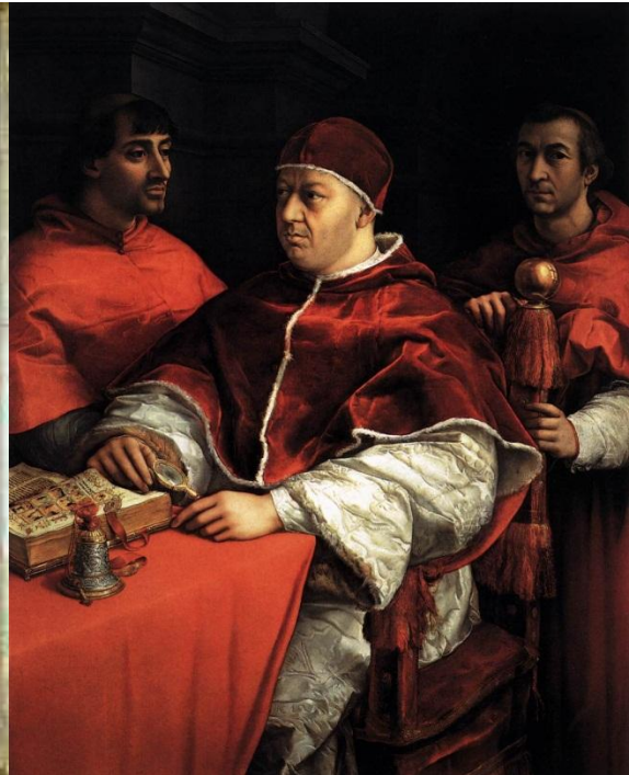
Slika 6. Papa Lav X.