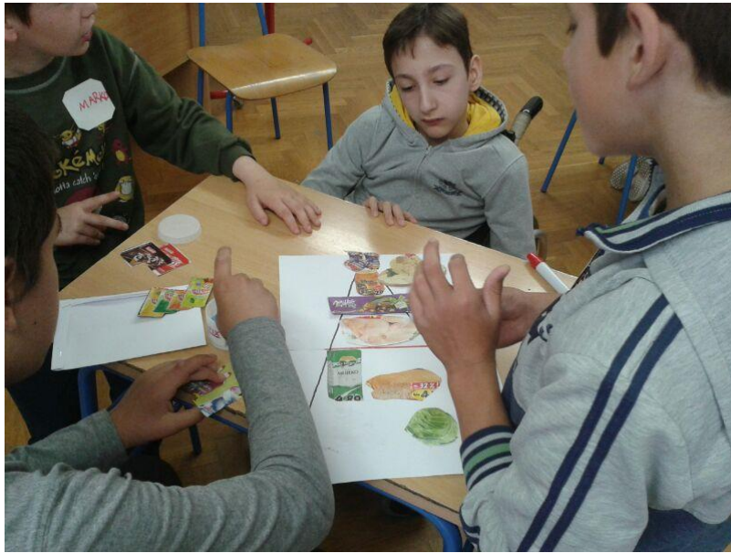
Slika 2. Učenci izrađuju „Piramidu zdrave prehrane“

Kako bih pomogla učenicima, na ploču sam im nacrtala shematski prikaz piramide zdrave prehrane, s točno obilježenim mjestima gdje koja namirnica stoji. Tijekom rješavanja zadatka imali su problema prilikom rangiranja i lijepljenja namirnica. Neki učenici nisu sudjelovali nego su samo sjedili unutar skupine (Slika 2). Bili su opterećeni time da svaku namirnicu stave na točno mjesto i bojali su se zalijepiti sličicu. Ono što sam zamijetila tijekom ove aktivnosti zabilježila sam u svoj istraživački dnevnik: