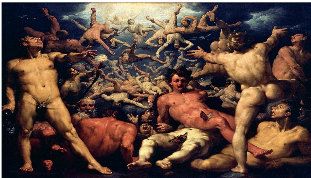
Slika 2. Cornelis van Haarlem: Pad Titana, 1588. 26

U pogledu klasične umjetnosti i svijetu starih bogova ističu se elementi prirode koji zatamnjuju duhovnost. Zato je u duhovnom pogledu tu još uvijek sve nejasno, mutno. Tomu nasuprot, u svijetu novih bogova ističu se elementi duhovnosti kao slobodne individualnosti: