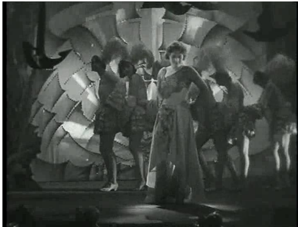
Abb. 8: Halbtotale

Halbtotale – Diese Einstellung, auch medium long shot 132 genannt, zeigt einen Teil eines Raumes, in dem sich die Person, oder mehrere Personen aufhalten.