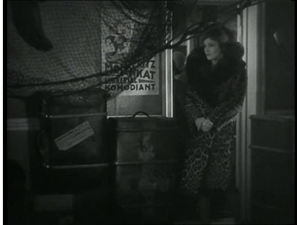
Abb. 7: Halbnahe

Halbtotale – Diese Einstellung, auch medium long shot 132 genannt, zeigt einen Teil eines Raumes, in dem sich die Person, oder mehrere Personen aufhalten.