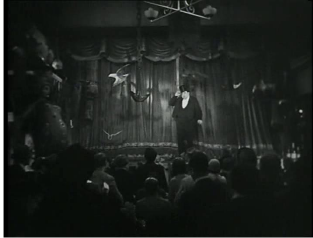
Abb. 9: Total

Weit – Die Weitaufnahme, auch extreme long shot 134 genannt, zeigt eine weit ausgedehnte Landschaft. Im Film kann man öfter Bilder einer wunderschönen Landschaft sehen. Hierzu das Beispiel.