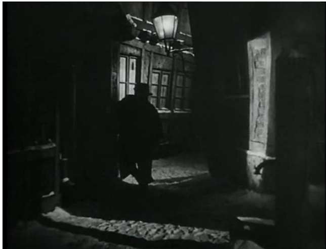
Abb. 10: Weit

Weit – Die Weitaufnahme, auch extreme long shot 134 genannt, zeigt eine weit ausgedehnte Landschaft. Im Film kann man öfter Bilder einer wunderschönen Landschaft sehen. Hierzu das Beispiel.