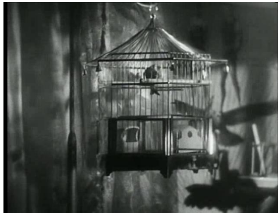
Abb. 4: Groß

Groß – Die Großaufnahme, auch close-up 128 genannt, zeigt die Person nur von den Schultern aufwärts, konzentriert den Blick auf den Kopf und das Gesicht.