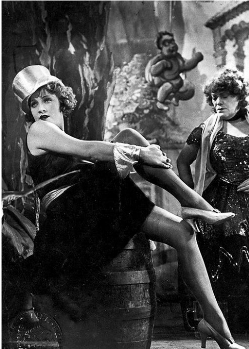
Abb. 1: Marlene Dietrich

Sie steht immer alleine auf der Bühne, alle anderen sitzen an der Seite. Sie trägt auf der Bühne sehr kurze Röcke, Strumpfhosen mit Halter, Stöckelschuhe und etwas im Haar.