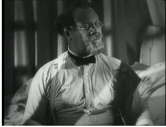
Abb. 5: Nah

Amerikanisch – Die Amerikanische Einstellung, auch medium-shot 130 genannt, zeigt die Person vom Kopf bis zu den Oberschenkeln, wo im Western der Colt zu hängen pflegt. Diese Einstellungsgröße wurde nicht sehr oft im Film verwendet.