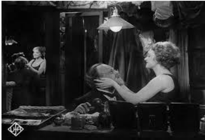
Abb.2: Professor Unrat und Lola Lola