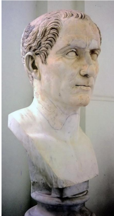
Slika 3 – Julije Cezar