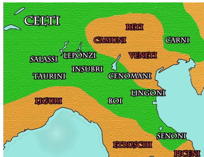
Slika 2 – Galska plemena na Apeninskom poluotoku

Nakon prvog vala prodora Gala na Apeninski poluotok nije bilo novih prodora sve do 360. g. pr. Kr. Gali, koji su u međuvremenu zavladaali Felsinom, koji su preimenovali u Bononiju (Bologna), stižu do Albanskih planina. No ovaj put ne napadaju Rim, koji je u međuvremenu pojačao zidine. Skupine Gala od tada služe u ratovima na tlu Italije kao plaćenici. 13