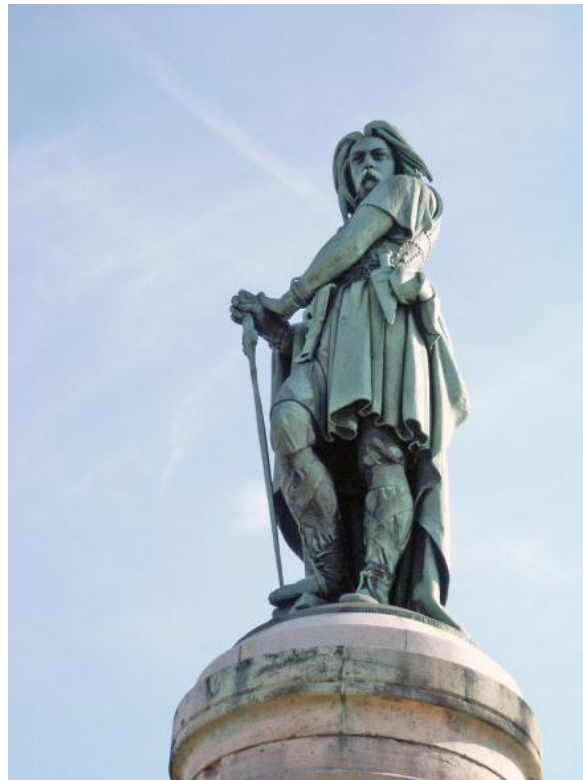
Slika 5 - Vercingetoriks

Cezarove ranije intervencije u Galiji bile su njegov odgovor na poziv u pomoć od strane vođa savezničkih plemena, kao što je i Ariovist bio pozvan u Galiju da pomogne Senonima u njihovoj borbi s Edućanima. Galska plemena, iako dijele jezik i kulturu, često su bila neprijateljski raspoložena jedna prema drugima. Mnoga su plemena profitirala dolaskom rimskih legija, a posebice Edućani zbog prijateljstva Cezara i njihovog vođe Divicia. No tijekom 53. g. pr. Kr. dolazi do jačanja prijezira i neprijateljstva prema Rimljanima. U zimu s 53. na 52. g. pr. Kr. grupa galskih aristokrata potajno se okupila i planirala koordiniranu pobunu. Na tom je sastanku odabran vođa predstojeće pobune, bio je to Vercingetoriks. 63