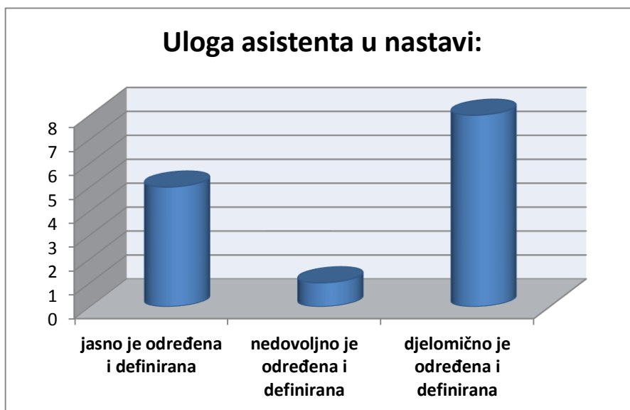
Grafikon 2. Prikaz odgovora učitelja/nastavnika o ulozi asistenta u nastavi (N=15)

Zadnja tri pitanja bila su otvorenog tipa, a tiču se promjena u suradnji s roditeljima djeteta posredstvom asistenta, promjena u nastavi te promjena u ponašanju djeteta otkad ima asistenta.