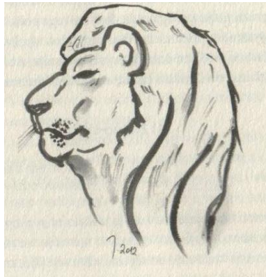
Slika 2.: Crtež Kublaj-kanova lava 124

osjeća kao kanov lav. Svih godina u službi (...) donosio je kanu priče izdaleka kao što mu lavovi donose divljač u raljama.“ 123