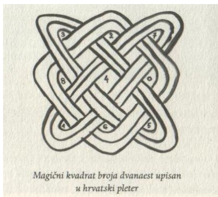
Slika 4.: Magični kvadrat broja dvanaest ugrađen u hrvatski pletar 138

kvadrat broja dvanaest. Riječ je o kvadratu, matematičkom fenomenu, u kojemu je suma svakog stupca, retka ili dijagonale jednaka broju 12. 137