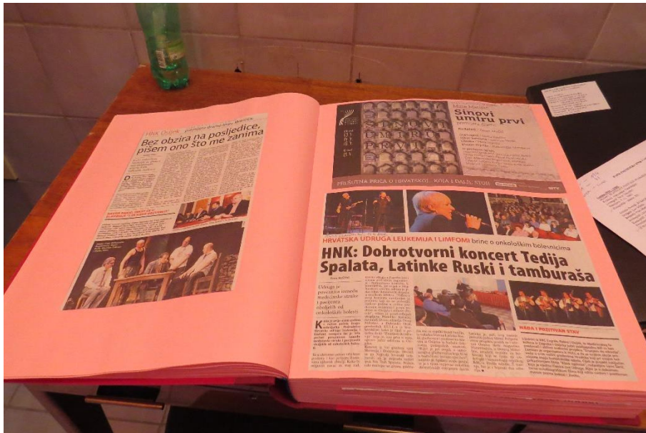
Fotografija 8. Slika uvezane knjige press clippinga