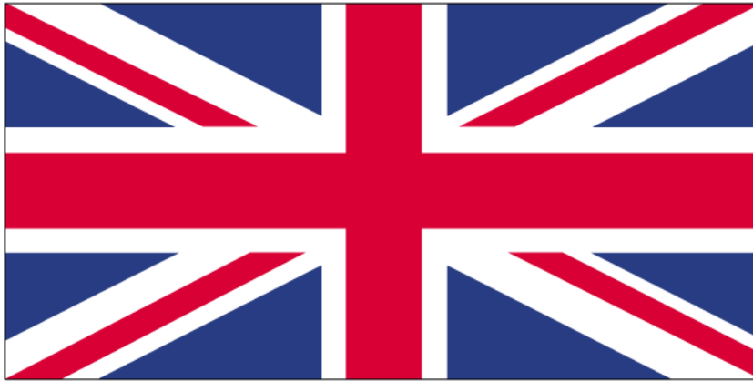
Slika 1. Slika zastave Ujedinjenog Kraljevstva

Može se vidjeti na zastavama Australije, Novog Zelanda te otočja Fidži i Tuvalu, ali i na zastavi Američke savezne države Havaji, iako oni nikada nisu bili u posjedu Velike Britanije. 27