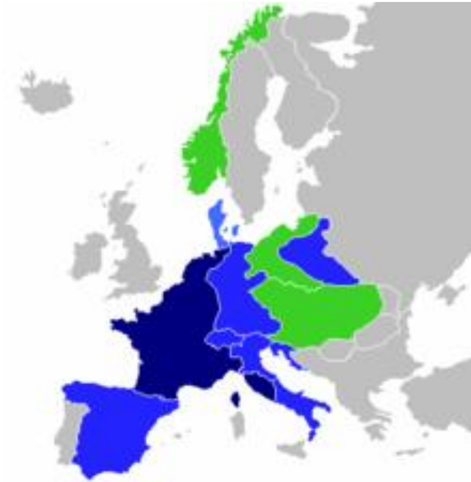
Prilog 3: Francusko Carstvo za vrijeme Napoleona Bonapartea (tamno plava – Francusko Carstvo, svjetlo plava – francuske „satelitske“ države, zelena – države s kojima je Francuska bila u savezničkim odnosima)