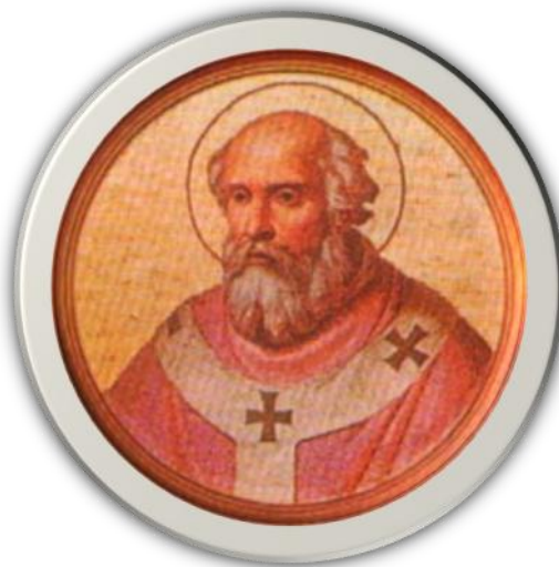
Slika 2. - papa Leon IX.