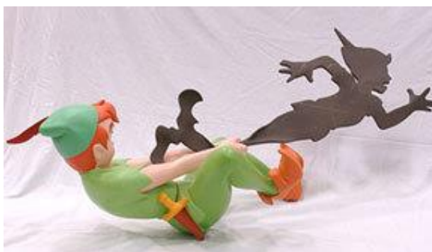
Slika 4. Sjena ponekad odgovara mračnoj strani Jastva, i kao takva je često prikazana (na slici kao „zločesta“ Sjena Petra Pana) 12

Jung razlikuje dvojak oblik Sjene, premda oba oblika označuje istim nazivom. Prvi je oblik forma „osobine Sjene“ koja sadrži one duševne crte pojedinca koje uopće nisu ili koje su jedva doživljene. Drugi oblik je „kolektivna Sjena“ koja se već ubraja i spada u figure kolektivnog nesvjesnog i, primjerice, odgovara negativnom liku starog mudraca ili mračnoj strani Jastva; takoreći ona simbolizira „naličje“ vladajućeg duha vremena, njegovu prikrivenu suprotnost. (Jacobi, 2006: 141)