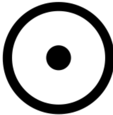
Slika 2. Središnja točka je Ego, koji pripada svjesnom, a Jastvo predstavlja i cijeli krug i središnju točku (i svjesno i nesvjesno) 3

Jastvo je prema Jungu arhetipska slika koja posredstvom zajedničkog središta (važan je pojam kolektivno nesvjesno, „skladište“ nesvjesnih sadržaja koje su ljudi razvili tijekom evolucije) vodi k povezivanju oba parcijalna psihička sustava.