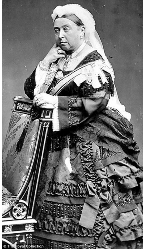
Prilog 1: Kraljica Viktorija